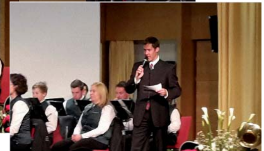
Ausgabe Nr. 97