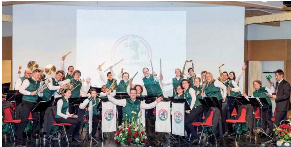
Ausgabe Nr. 97